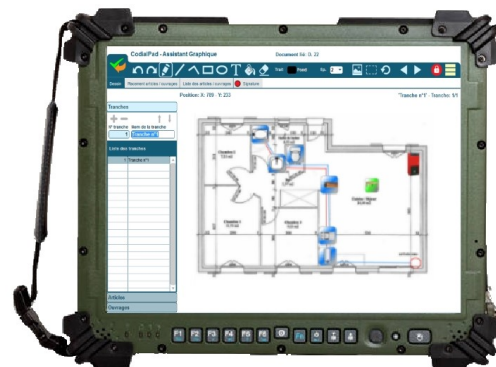
CodialPad sur tablette semi-durcie